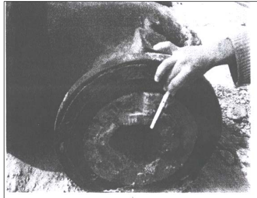
Photo.02. entartrage au niveau des équipements du réseau de distribution.