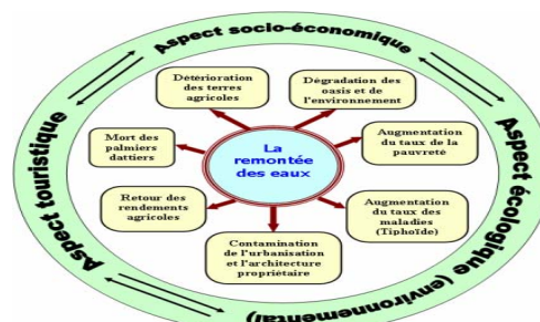
Fig.1: La remontée des eaux : noyau central des obstacles freinant les axes de développement durable (KHECHANA,S, 2007)

Le passage de l'habitat en Médina à l'état en « ville moderne » interroge sur les conséquences induites sur le mode de vie, de sociabilité, de pratique de la vie ; en un mot sur l'urbanité nouvelle que cela engendre : les nouveaux modes de vie qui entraînent des exigences nouvelles par rapport à l'habitat, au confort, à l'utilisation des espaces de la maison, au rythme de la consommation des eaux,... etc.