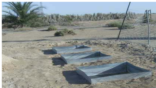
Photo.1. Bacs type Colorado

Les bacs choisis pour notre travail sont des bacs enterrés de type Colorado déjà adoptés par le service de l'Hydraulique en Algérie [8]. Ce sont des bacs construits localement avec des tôles de galvanisai et des dimensions de 1x1x0.5 m 3 . Ces bacs ont été enterrés l'un près de l'autre en gardant un écartement de 50 cm et une hauteur de 10 cm au dessus du niveau naturel du sol. L'eau affleure sensiblement au niveau du sol (Photo.1).