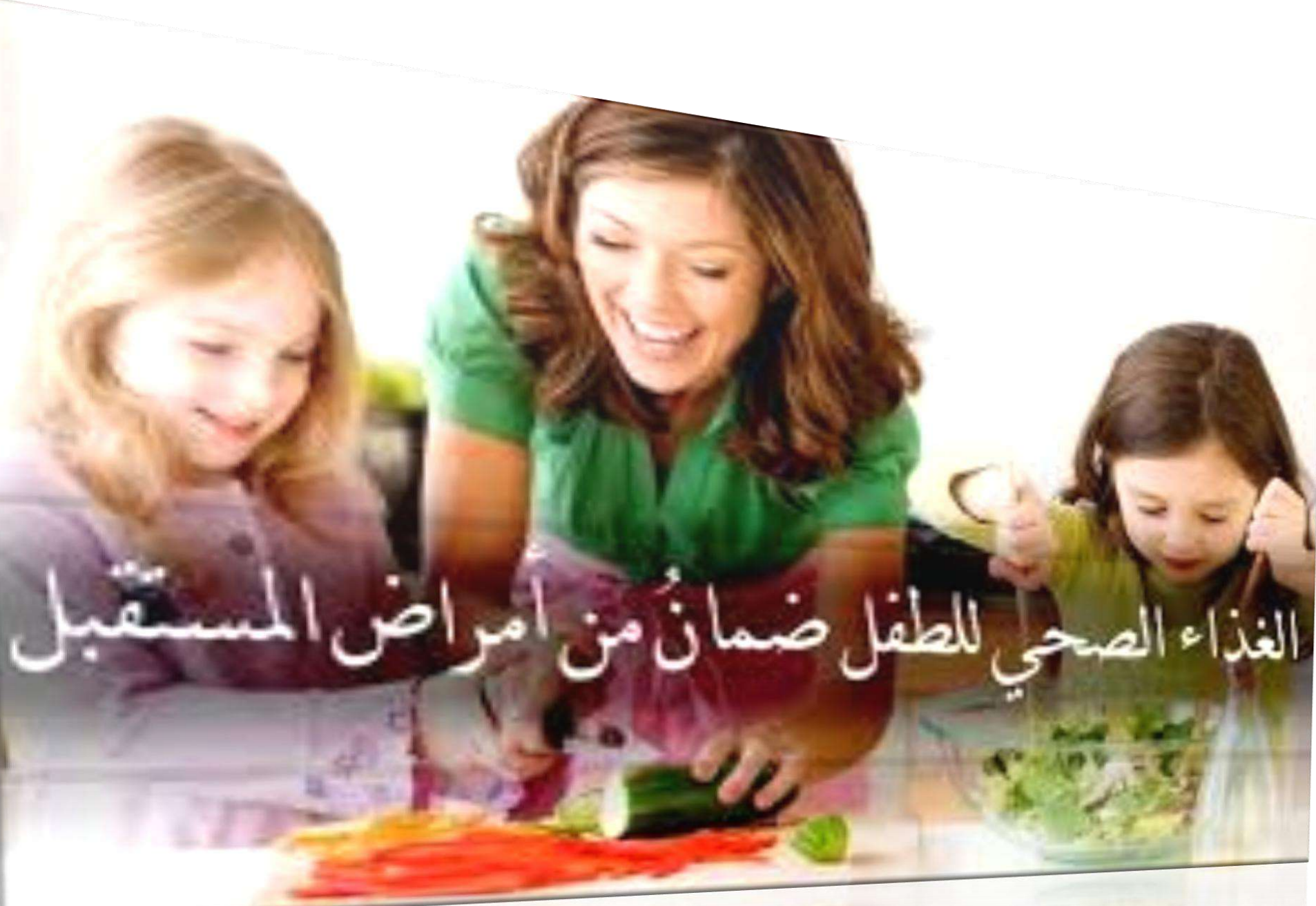
الغذاء الصحي للطفل ضمان من امراض المستقبل