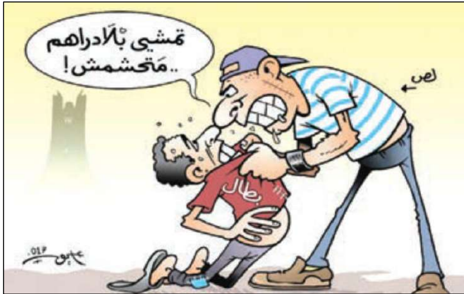
من ظواهر سياسة التقشف