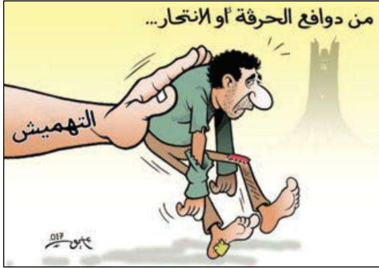
من دوافع الحرقة أو الانتحار