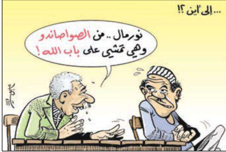
الوضع الاجتماعي في الجزائر