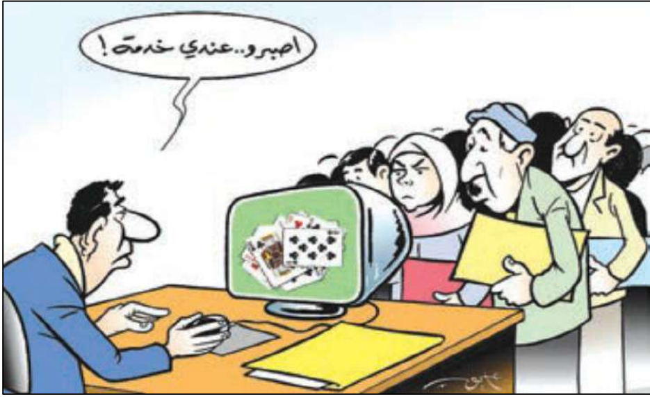
سوء الخدمة الاجتماعية