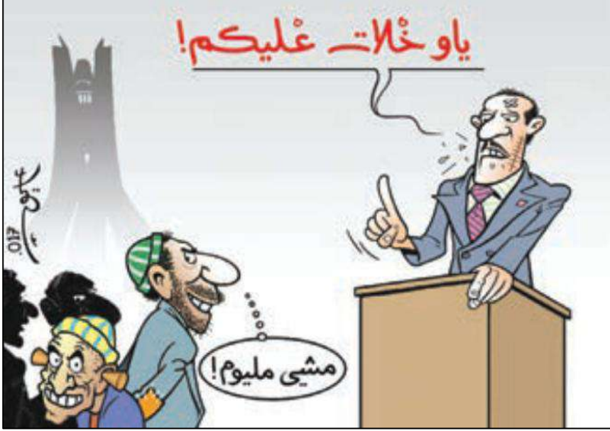
أزمة ارتفاع الأسعار