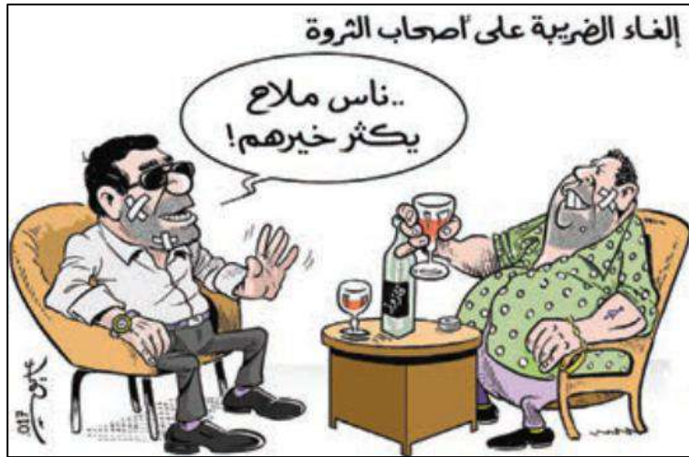
إلغاء الضريبة على أصحاب الثروة