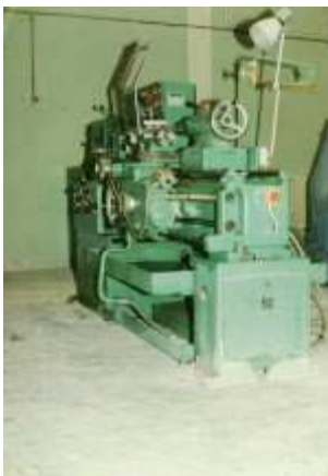
Fig.1 : Tour utilisé pour les essais du laboratoire LaMSM