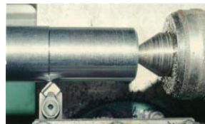
Fig.3 : Epreuve d'essai en Acier XC 42 Dimensions : ( \varnothing 90x500)