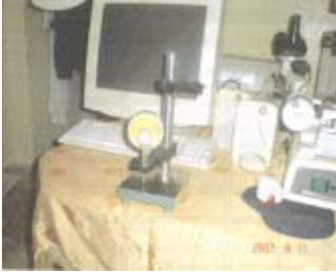
Fig.5 : Microscope optique du laboratoire LaMSM