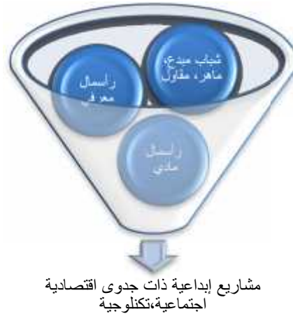
شكل 2: مدخلات ومخرجات الحاضنة التكنولوجية

فالمهارات المعرفية من الإدراك والتصور والتخيل والحصول على المعلومات لها قيمة يمكن أن يدفع الزبائن ثمناً للحصول عليها عبر شرائهم السلعة أو الخدمة المميزة ذات الجودة العالية 14 .