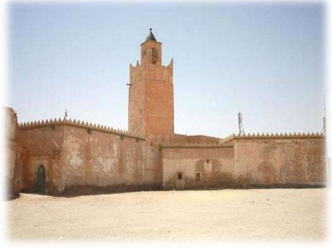
الملحق رقم (05): قصر مستاوة