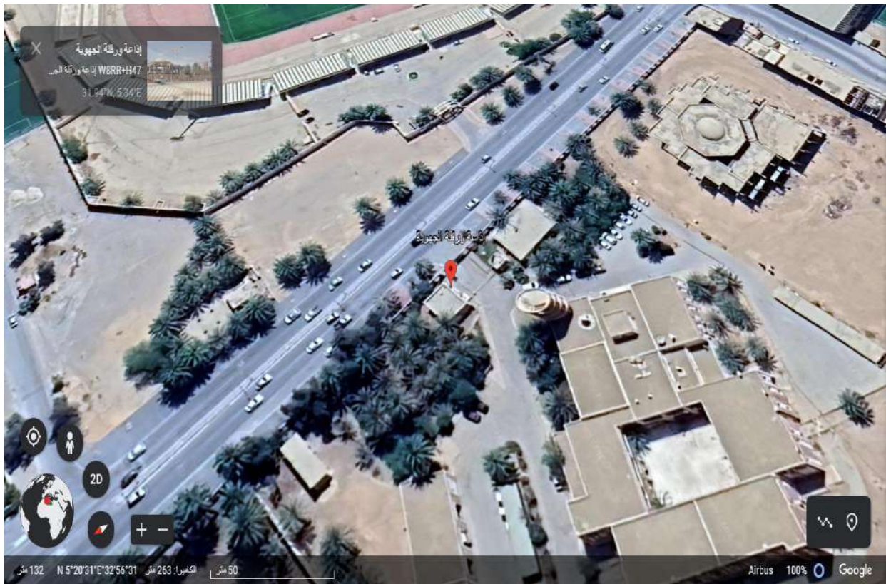
صورة للإذاعة الجهوية بورقلة