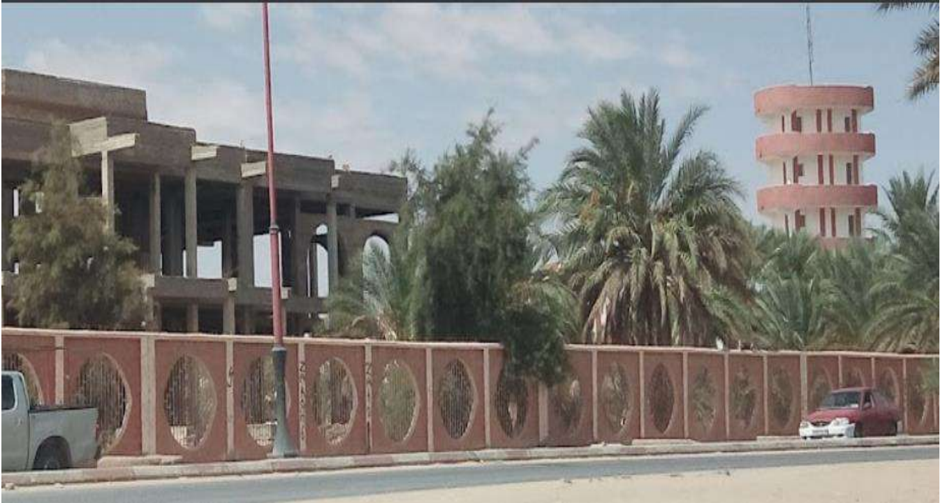
صورة حقيقة لموقع اذاعة ورقلة الجهوية