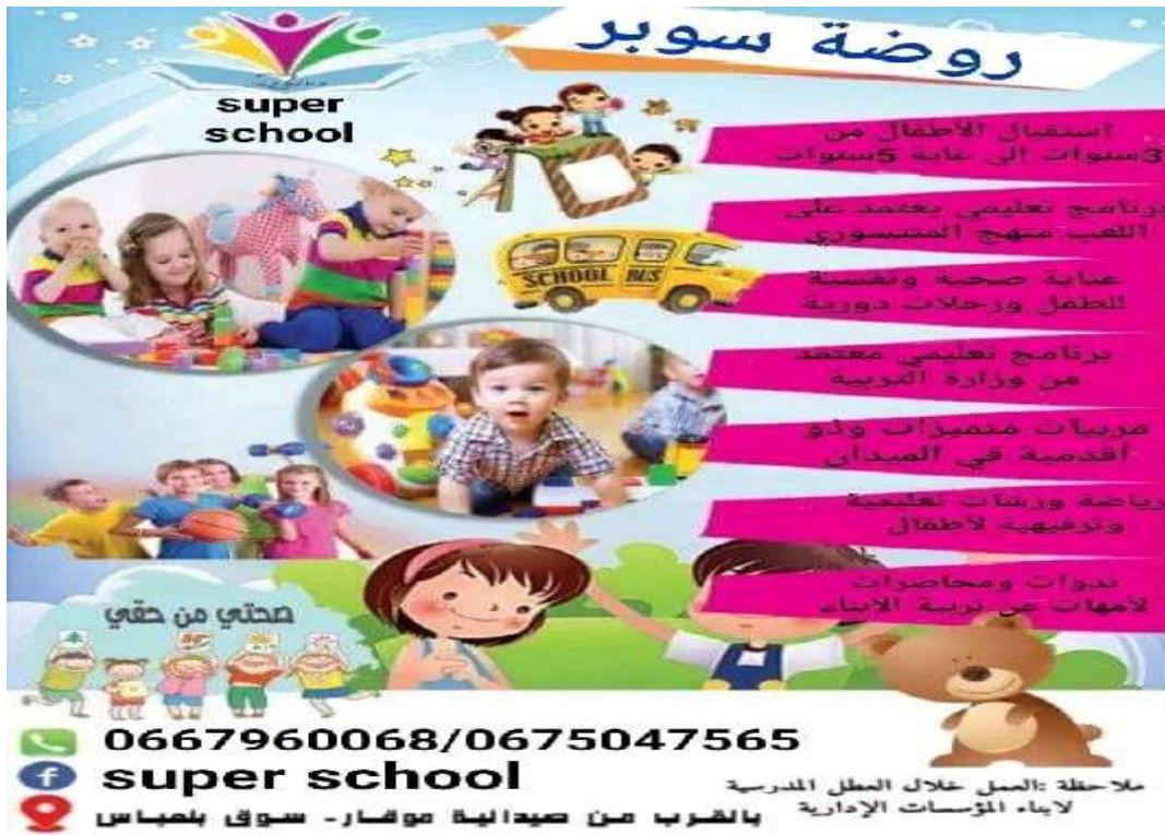
(1) وسائل التواصل و موقع "مدرسة سوبر للتعليم و التدريب"