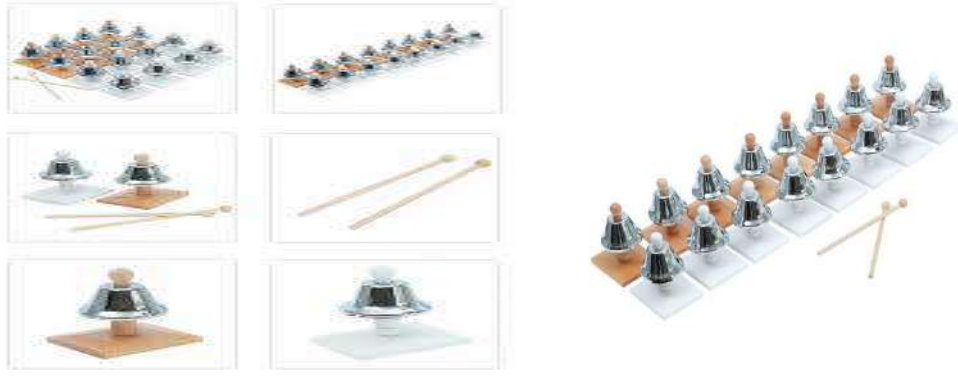
(2) "الأجراس الموسيقية"