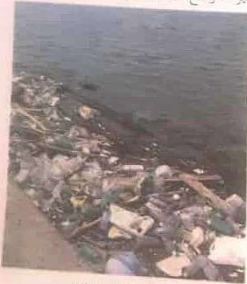
من مظاهر التلوث البيئي