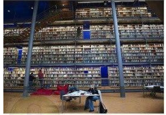
سنويا تطبع ألمانيا 200 مليون