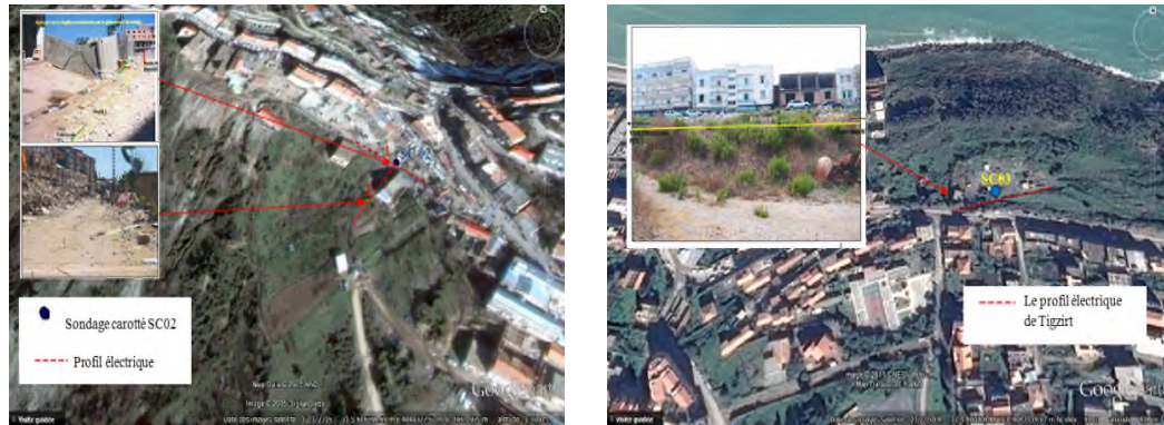
Figure 1. Localisation du profil électrique sur le site de Tizirt à gauche et les des deux profils électriques I et II sur le glissement d'Ain El Hammam à droite