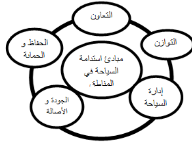
شكل 2 مبادئ استدامة السياحة فى المناطق التراثية