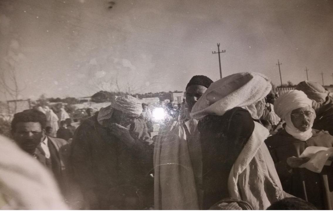
الملحق 5: صورة من جنازة الشيخ الطاهر العبيدي