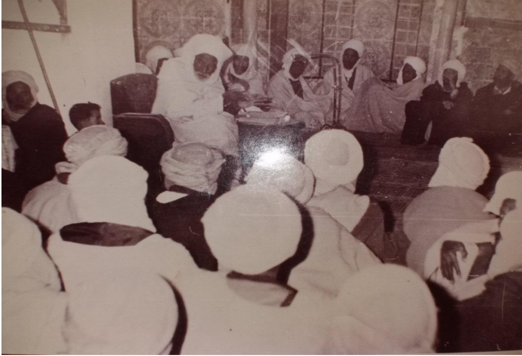
الملحق 3: الشيخ اثناء القاء درسه بالمسجد الكبير