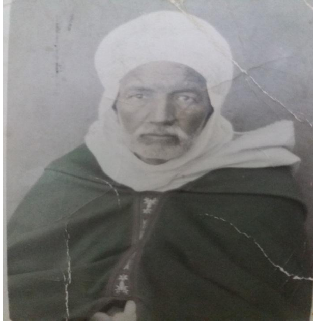
الملحق 1: صورة للعلامة الطاهر العبيدي