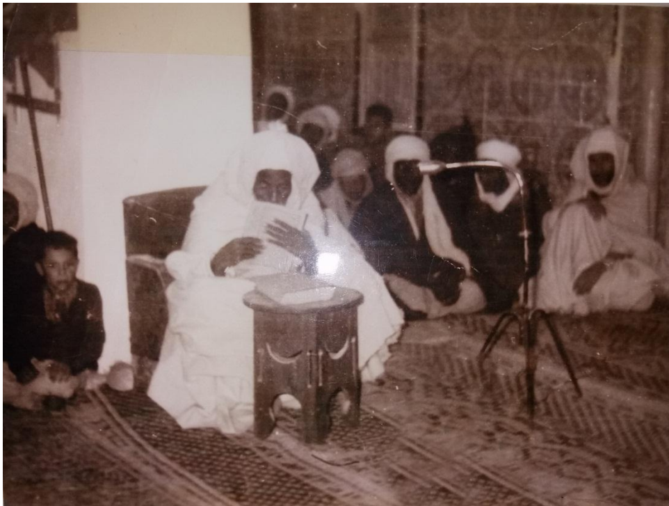
الملحق 4: صورة للشيخ اثناء القاء درسه بالمسجد الكبير