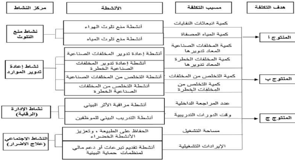
الشكل (3): نظام التكاليف على أساس الأنشطة لتخصيص التكاليف البيئية