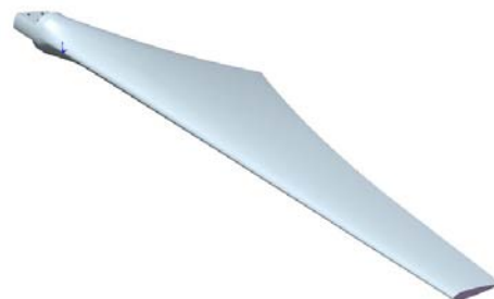
Figure 2 Vue isoparamétrique de la pale concave

Mots clés : pale, éolienne, NACA 23015, profile aérodynamique, CAO, corde, calage