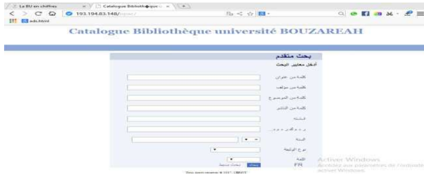
الشكل (3): واجهة البحث المتقدم للفهرس الآلي المتاح على الخط المباشر

يمكن إجراء عمليات البحث عن المصادر المتوفرة في المكتبة المركزية باستعمال خدمة البحث البسيط أو المتقدم حيث يمكن للمستخدم الوصول إلى المعلومات الكاملة عن المصادر والمراجع وذلك بالنقر على رابط الفهرس الآلي المتاح على الخط المباشر فتظهر الواجهة الموضحة في الشكل التالي: