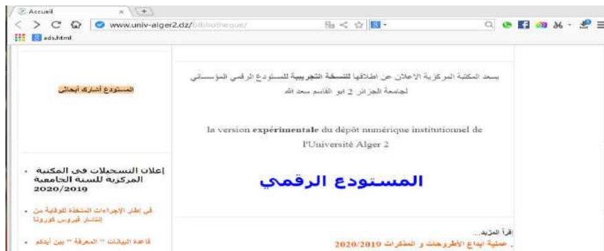
الشكل (4): يوضح واجهة الدخول إلى المستودع الرقمي للمكتبة المركزية.

في إطار مشروع يهدف إلى الاستفادة من الإنتاج العلمي للجامعة وتسهيل الوصول إليه قامت المكتبة المركزية بإنشاء المستودع الرقمي والذي هو عبارة عن أرشيف رقمي يحتوي على الإنتاج العلمي للباحثين في كل التخصصات بجامعة الجزائر 2 وتتم إدارة وتسيير هذا المستودع عن طريق منصة Dspace ، والوثائق المتوفرة عبر هذا الفضاء تتمثل في: مداخلات الملتقيات العلمية، أطروحات الدكتوراه، مذكرات الماجستير، المقالات المنشورة في مختلف المجالات العلمية.