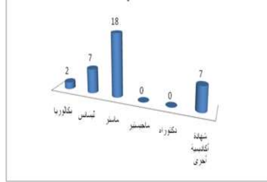
الشكل (1) : تقسيم العينة حسب المؤهل العلمي