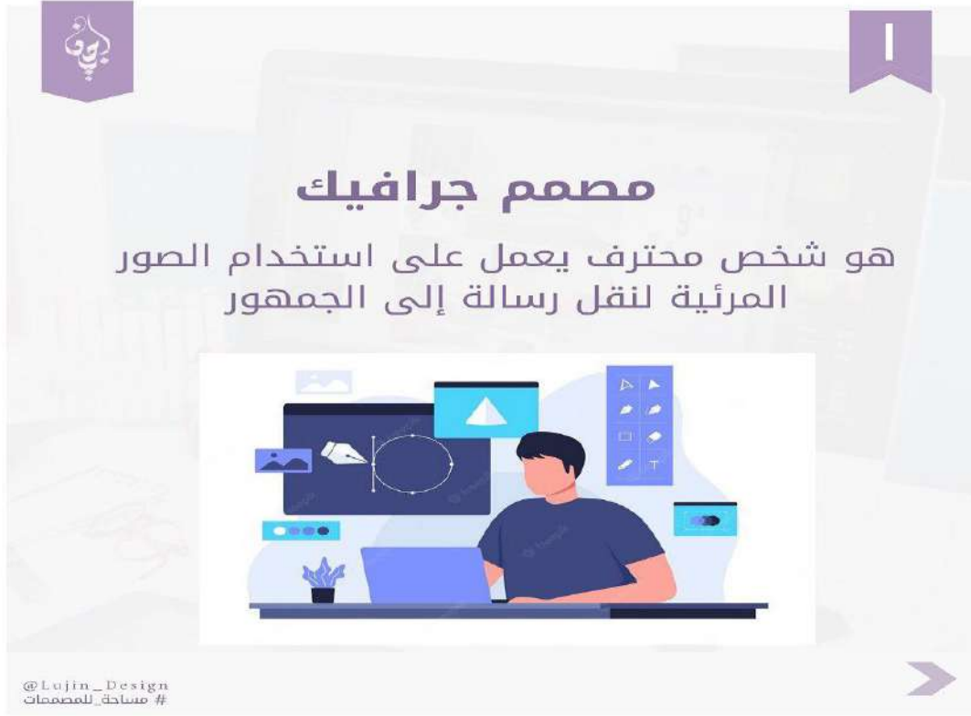
الصورة رقم:05