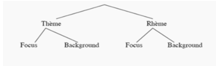
Fig. 1. Partition Fond-Focus (Cf. Halliday (1967), Steedman (2000)).

qui peut être représenté comme dans la figure (1) ( Cf. Halliday (1967), Steedman(2000)) ci-dessus :