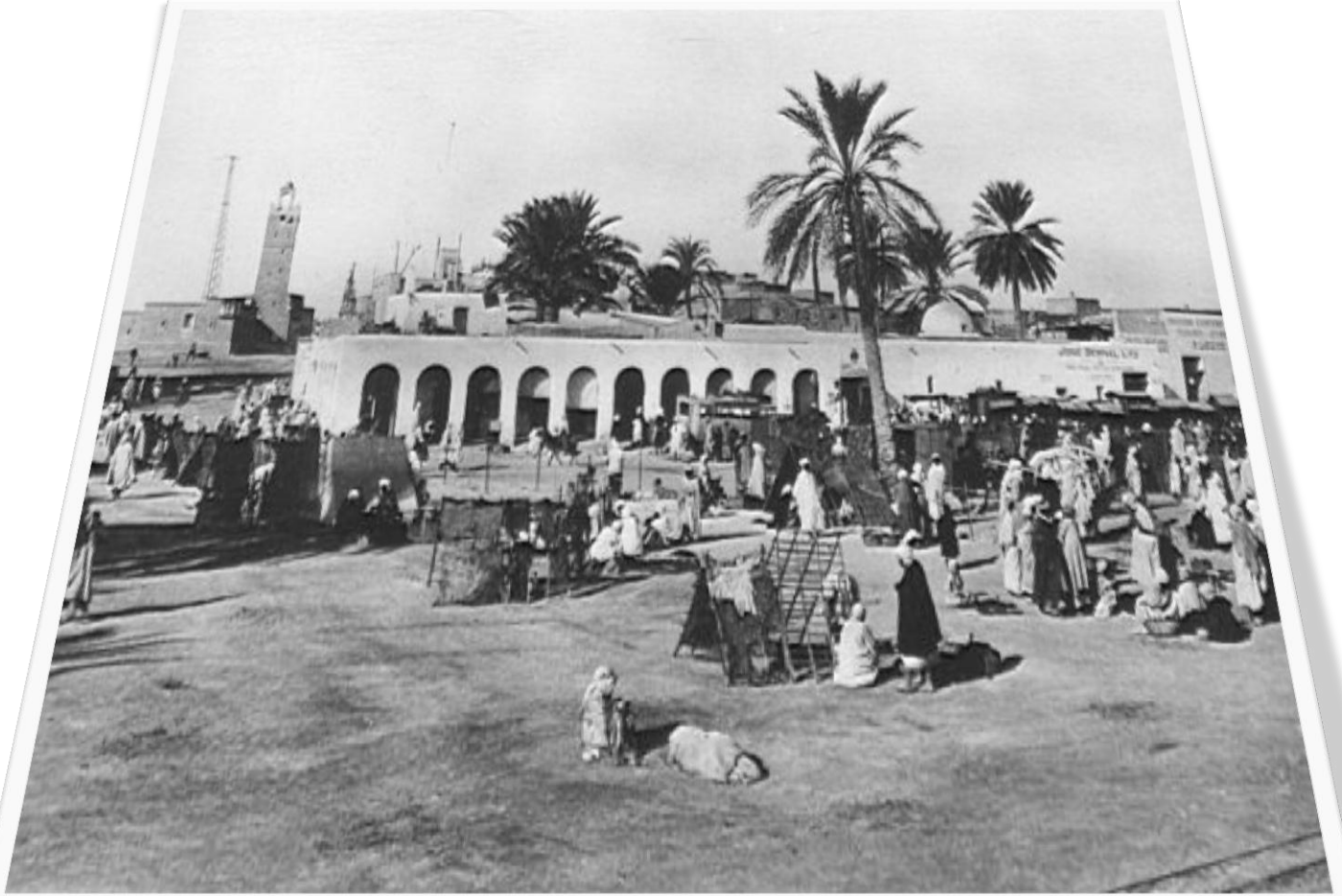
المكان الذي اقيمت فيه المظاهرات سوق الحجر (سوق الحطب قديما)