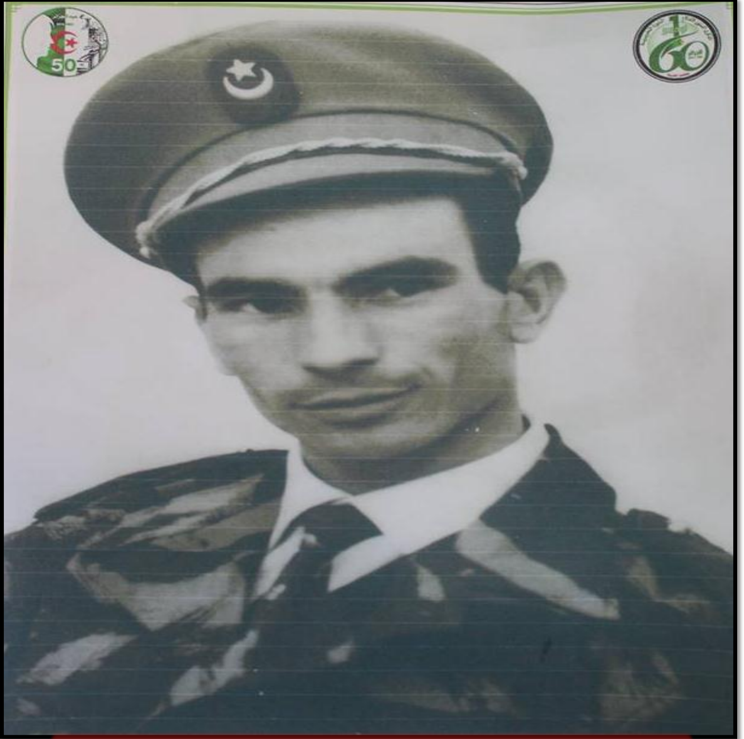
المجاهد العقيد محمد شنوفي القائد الرئيسي المكلف بتنظيم مظاهرات 27 فبراير 1962 بورقلة