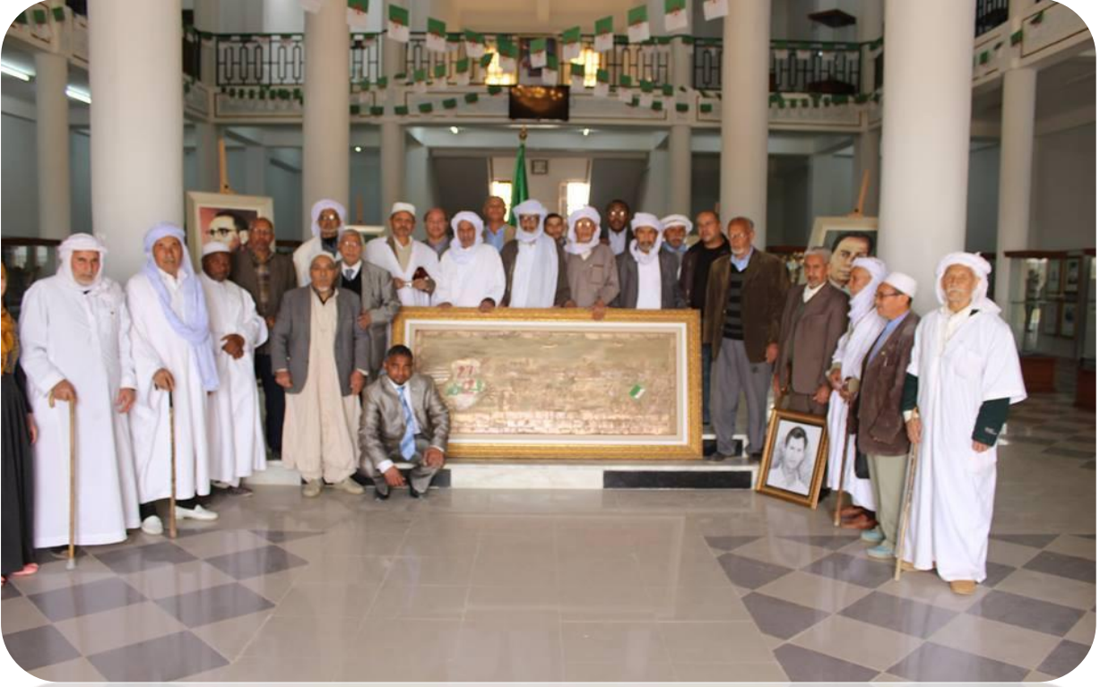
صورة لبعض المجاهدين الذين شاركوا في مظاهرات 27 فبراير 1962 بورقلة