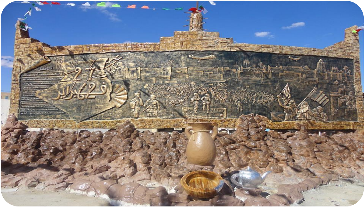
صورة لجدارية مخددة لمظاهرات 27 فبراير 1962 بورقلة